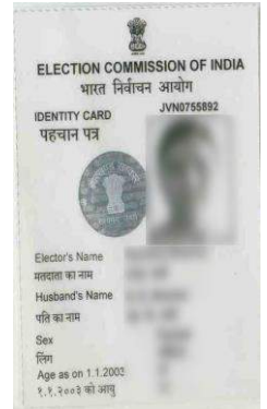
मतदाता पहचान पत्र

कोई भी आधिकारिक दस्तावेज न होने की स्थिति में -