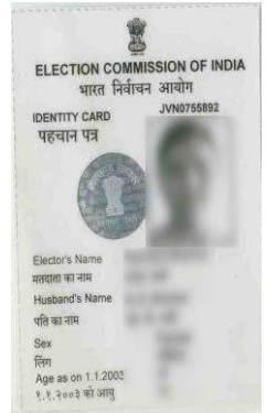
ଭୋଟର ପରିଚୟ ପତ୍ର