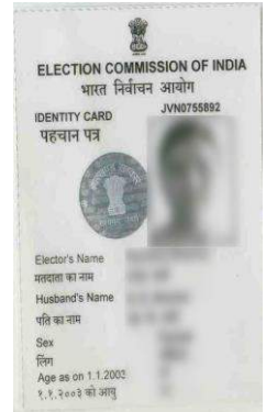
Voter ID Card

எந்த அதிகாரப்பூர்வ ஆவணங்களும் இல்லாத போது - சமீபத்திய புகைப்படம் மற்றும் சில நிபந்தனைகளின் கீழ் வங்கி அதிகாரி முன்னிலையில் கையொப்பம் அல்லது பெருவிரல் ரேகை இட்டு சிறிய கணக்குகள் ( Small Accounts ) திறந்து கொள்ளலாம்.